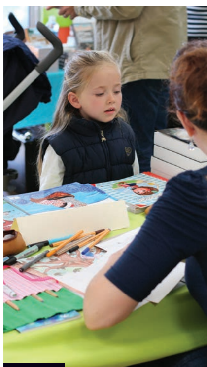
Salon du livre