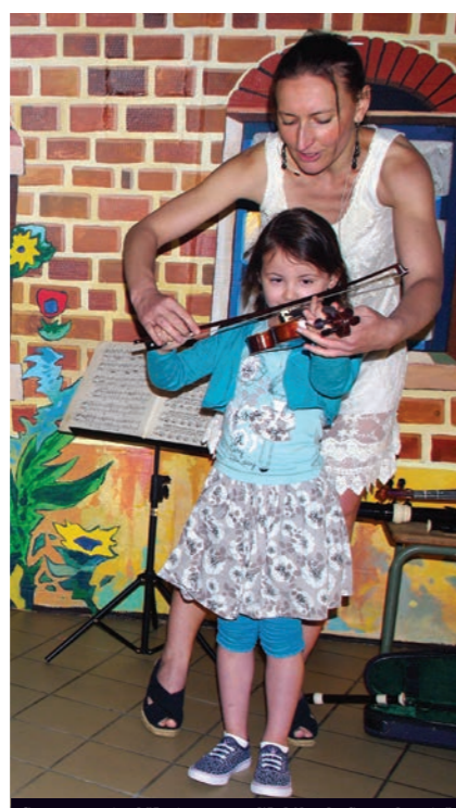
Conte musical "Animezzos d'Adélaïde Symphonia"